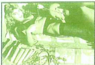
Caldas da Rainha

ORGANIZADO A PARTIR DE TRABALHOS INSCRITOS NO FESTIVAL.