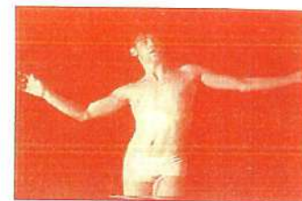
Fear of Disclosure

Este programa tem como objetivo apresentar produções de filmes e vídeos com a temática do HIV/AIDS que trazem uma visão pioneira dentro das perspectivas pessoal, política e social.