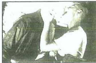
It Never Was You

Uma seleção de vídeos tratando explicitamente da sexualidade de garotos que gostam de garotos.