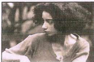
Quando Eu Falar Ação

Uma MIXtura de tensão, culpa, heresia, sensibilidade, poesia e carnaval dentro de contexto sócio-cultural brasileiro. Embora não caia numa categoria denominada "cinema gay", essa coletânea de filmes apresenta elementos que constroem uma possí-